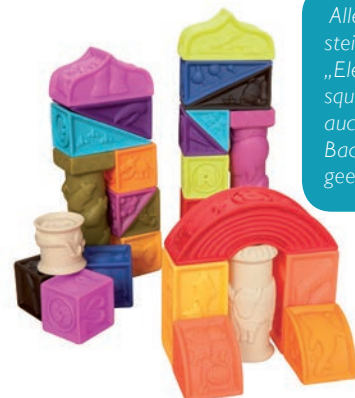
Alle Bausteine von „Elemosqueeze“ sind auch für die Badewanne geeignet

Die vielfältig spielbare Gitarre „Woofen“ beeindruckt Kinder ab 2 Jahren durch das originelle Hunde-Design. „Elemosqueeze“ wendet sich an die Kleinsten: Die 26 Würfel, Schrägen,