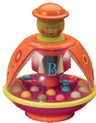
Bei „Poppitoppy“ drücken Kinder ab 1 Jahr den Kopf des Marienkäfers und bringen mechanisch die Scheibe unter den vielen kleinen Kugeln zum Drehen – schon springen die Bälle wild herum

Ausgeliefert werden Lernspielzeuge im unkonventionellen Design: Die 17,8 cm hohe „Poppitoppy“ präsentiert sich in transparenter Verpackung.