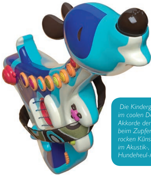
Die Kindergitarre „Woofen“ im coolen Design ermöglicht Akkorde der C-Dur-Tonleiter, beim Zupfen an den Seiten rocken Künstler ab 2 Jahren im Akustik-, Elektrik- oder Hundeheul-Modus