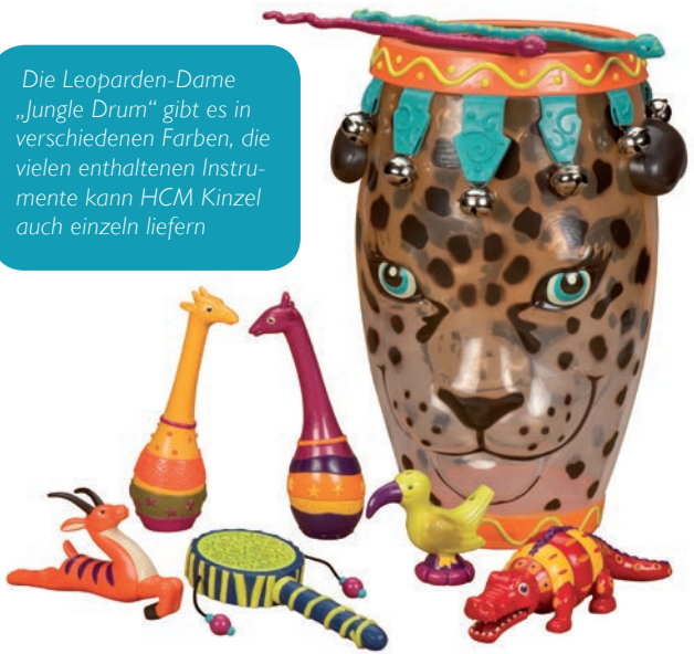
Die Leoparden-Dame „Jungle Drum“ gibt es in verschiedenen Farben, die vielen enthaltenen Instrumente kann HCM Kinzel auch einzeln liefern